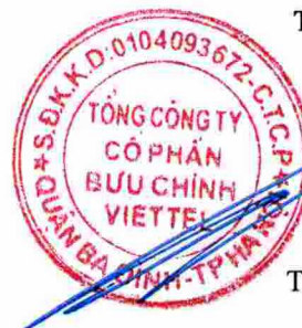
Trần Trung Hưng